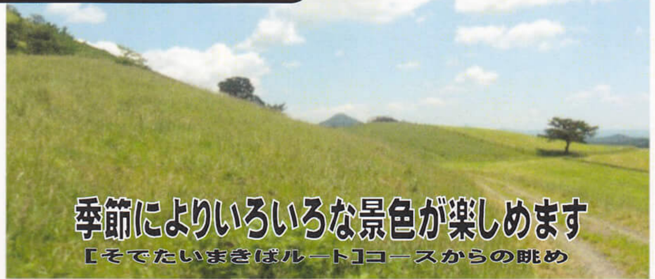
季節によりいろいろな景色が楽しめます 【そでたいまきばルート】コースからの眺め