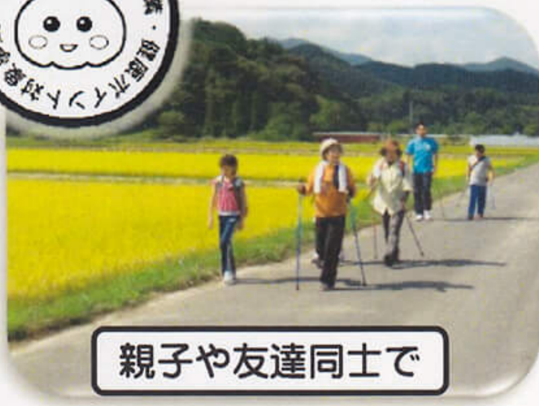
親子や友達同士で